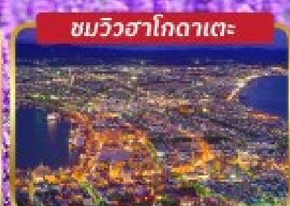
ชมวิวนาโกดาเตะ