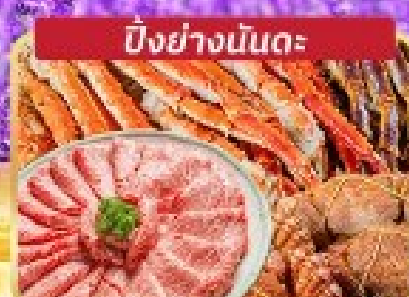
ปิ้งย่างมันตะ