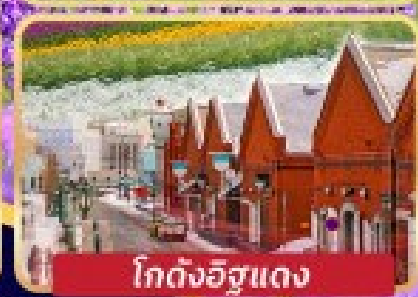
โกดังอิฐแดง