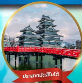
ปราสาทมัตสึโมโต้