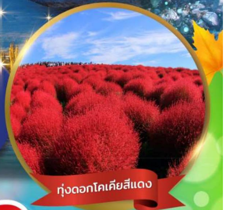
ทุ่งดอกโคเคียสีแดง

ชมใบไม้เปลี่ยนสีที่ คามิโคจิ • ทุ่งดอกโคเคีย ณ สวนชิตาชิชิไซด์ • ศาลเจ้าโอะอาไร ฟูจิชั้น 5 • พิธีชงชา • หมู่บ้านโอะชิโนะฮักโก • ปราสาทมัตสึโมโด้ (ชมด้านนอก) โอดะวะ กันดั้ม • ซุปบึงชินจูกุ • อีสระเต็มวัน เที่ยววัดสมัย หรือ ซุปบึงตามอรัญญาศัย