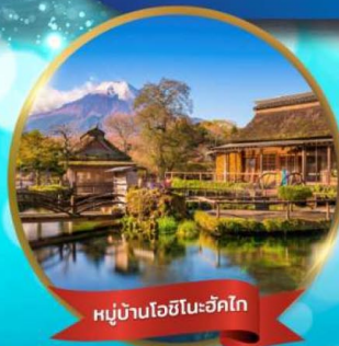
หมู่บ้านโอะชิโนะฮักโก