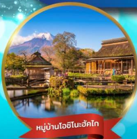
หมู่บ้านโอยิโนะฮักโก