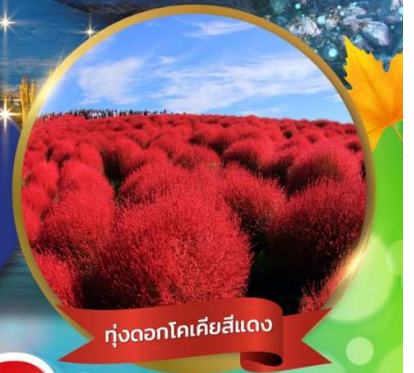
ทุ่งดอกโคเคียสีแดง

ชมใบไม้เปลี่ยนสีที่ คามิโคจิ • ทุ่งดอกโคเคีย ณ สวนชิตาชิไซด์ • ศาลเจ้าโองาไรอิ ฟูจิซัน 5 • พิธีชงชา • หมู่บ้านโอยิโนะฮักโก • ปราสาทมัตสึโมโต้ (ชมด้านนอก) โอบิตะ กันดั้ม • ซุปบึงชินจูกุ • อิสระเต็มวัน เที่ยวดิสนีย์ หรือ ซุปบึงตามอัธยาศัย