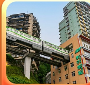
“นั่งรถไฟทะลุตึก”