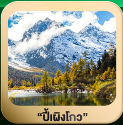
“ปี้ผิงโกว”

ชมธรรมชาติ 2 อุทยานขึ้นชื่อ อุทยานภูเขาสี่ครุณี + อุทยานปี้ผิงโกว สะพานหนานเฉียว • ถนนคนเดินไท่กู่หลี่ + ซุนซีลู่ + Pop Mart • ดงเจียวจี้