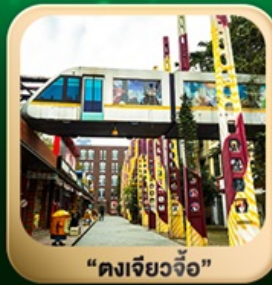
“ดงเจียวจี้”