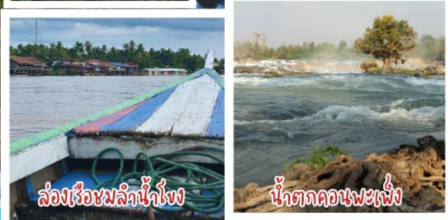
ล่องเรือชมลำน้ำโขง