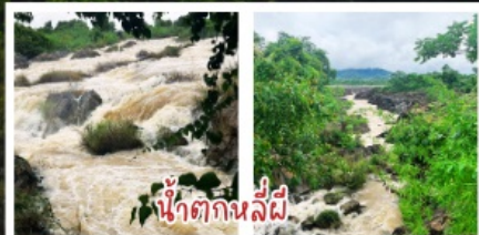
น้ำตกหลี่ยี