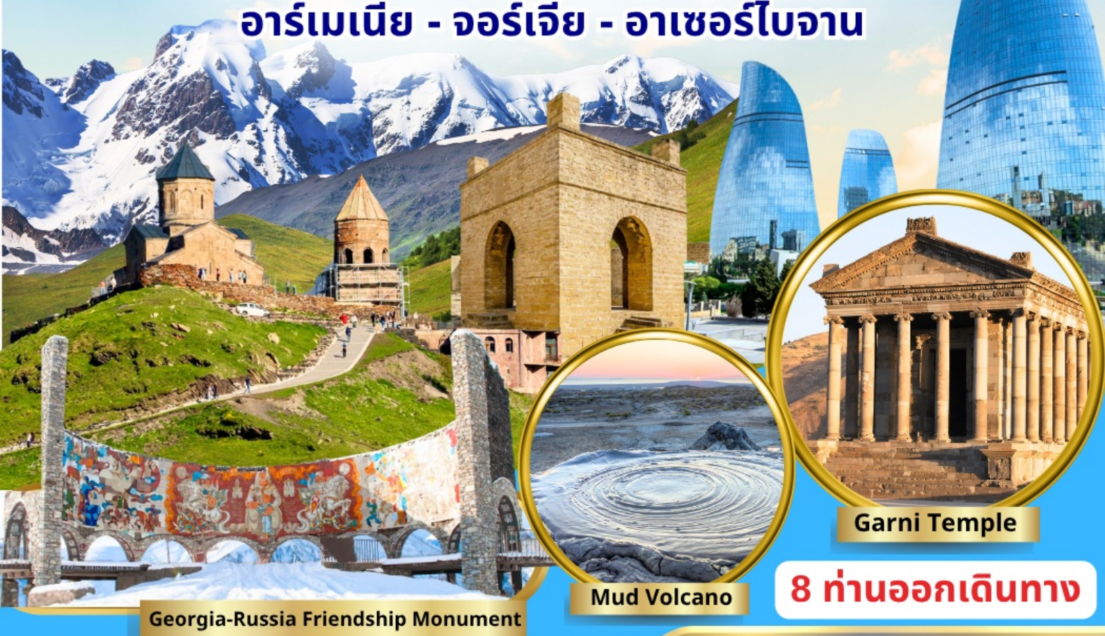
Georgia-Russia Friendship Monument