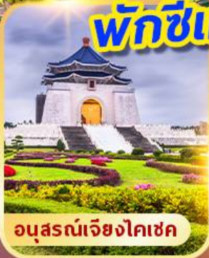
อนุสรณ์เจียงไคเชค