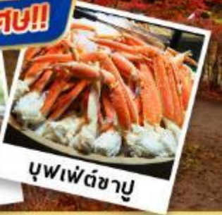
บุฟเฟ่ต์ชาบู