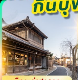
เมืองเก่าซาวาระ