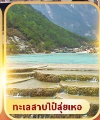
ทะเลสาบปิสุ่ยเหอ