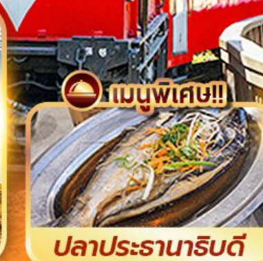
เมนูพิเศษ!! ปลาประดาน้ำริบตี