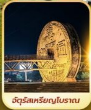
จัตุรัสเหรียญโบราณ