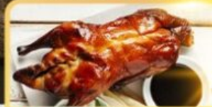
เปิด Four Season