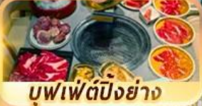
บุฟเฟ่ต์ปักกิ่งย่าง