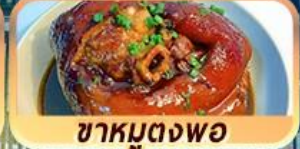
ชาหมูตงพอ