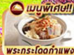
เมนูพิเศษ!! พระกระโดดกำแพง