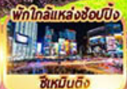
พิกโกลิแหล่งช้อปปิ้ง ซิเหมินตง