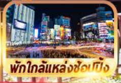
พัทไถลี้แหล่งช้อปปิ้ง