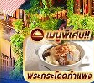
เมนูพิเศษ!! พระกระโดดกำแพง