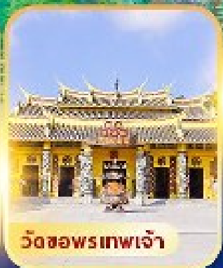
วัดซอพรเทพเจ้า