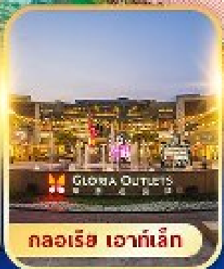
กลอเรีย เอาท์เล็ต