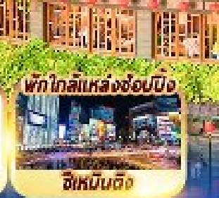
พัก ไทลีแหล่งช้อปปิ้ง ซิเหมินตง