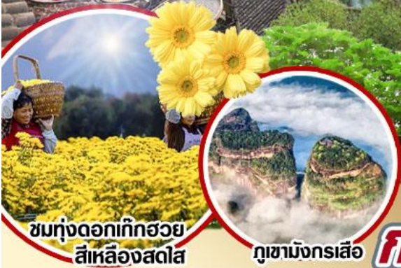
ชมทุ่งดอกเก๊กฮวย สีเหลืองสดใส