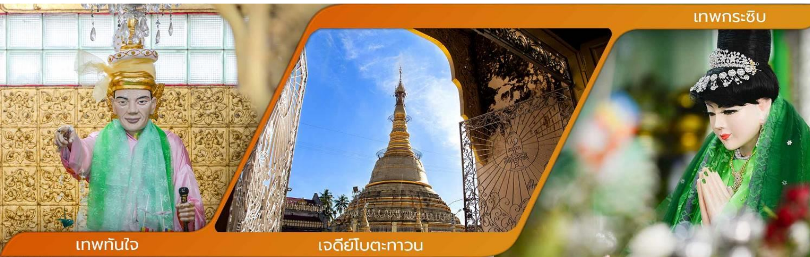
เทพทันใจ

คำบูชาเทพทันใจ เอหิ สักกะ มหานัทโปิระปิระจีโปตะถองสิทธิมัตถุ อิทังพะลัง เอตัสสะมิงรัตตะนัง พุทธังธัมมัง สังฆัง เทวานัง ประสิทธิลาโภ ชโยนิจจัง วันทามิสัพพะทา สวาโหม