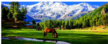
แฟร์มีโดวส์

** พักที่ Raikot Sarai Hotel หรือเทียบเท่า **