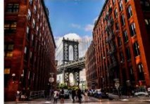
ย่านคัมโบ้

** พักที่ Holiday Inn Express & Suites Jersey City Hotel 4* หรือเทียบเท่า **