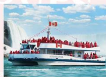
อุทยานแห่งชาติในแควอาร่าฝั่งแคนาดา