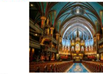
วิหารนอร์ธเทอดาม

** พักที่ Holiday Inn Express & Suites Ottawa Hotel 4* หรือเทียบเท่า **