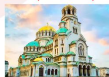
Alexander Nevsky Cathedral

15.45 น. ออกเดินทางสู่สนามบินอิสตันบูล เที่ยวบิน TK1032 17.20 น. เดินทางถึงสนามบินอิสตันบูล แวะเปลี่ยนเครื่อง 20.30 น. ออกเดินทางสู่กรุงเทพฯ เที่ยวบิน TK64