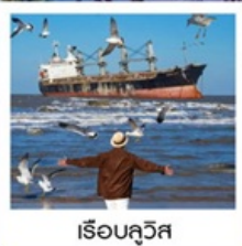
เรือบลูวิส