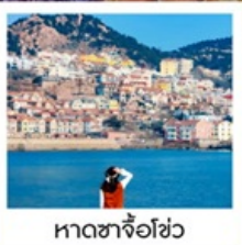
หาดซาจื่อฮั่ว