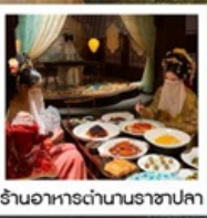
ร้านอาหารตำนานราชาปลา