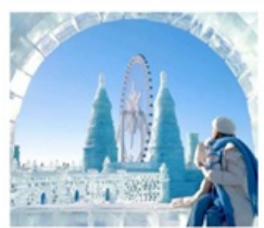
ICE & SNOW FEST.