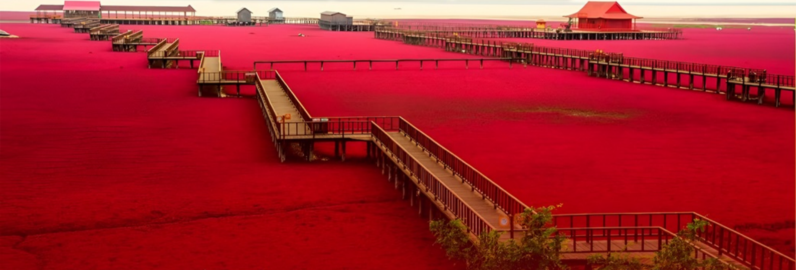
ดางไป่ซาน

นั่งรถไฟความเร็วสูง จาก เสิ่นหยาง ไป ดางไป่ซาน