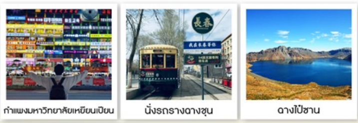
กำแพงมหาวิทยาลัยเหยียนเปียน