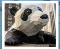
ห้าง IFS แพนด้าป็นตึก