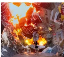
SPACE & TIME CUBE