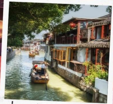
ล่องเรือจูเจียเจี้ยว