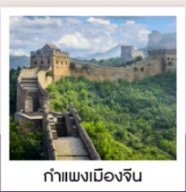
ท่าแพงเมืองจิน