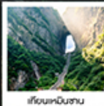
เซียมเหินชาน

แอมบูกันยอน / สพานกั๋วหย่าวโหลว / เขาสียมเหินชาน / เรือชิงกั๋ว / ประตูสวรรค์ / ไร่ทองคำจางเจียเจีย / เขาสียมเหินชาน สวนจอนฟงเหินต๋อง / ภาพวาดทราย / เมืองฟูหลงเจิน / ล่องเรือตามลำน้ำต๋อเจียง / เขามือโบราณฝ่งหวงยกน้ำดื่ม