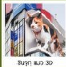
ชินจูกุ นวน 3D