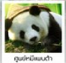
ดูแม่กบิ๊ตเตนต้า

อุทยานหวงหลง / อุทยานจิ่วจ้ายโกว / โรวี่ทิงตงดูแม่กบิ๊ตเตนต้าแพนด้าจูจิงเซี่ย / สวนจอกเฟิ่น / ระเบิดงกั๋ว / ถนนถนนเดินสูบซีง / ถนนโบราณจีนหนี่