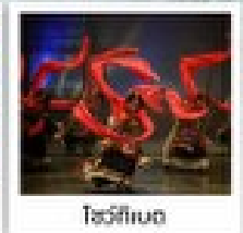
โรวี่ทิงตง