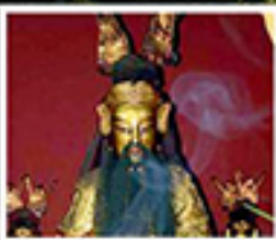
เอียงบู๊ซิว