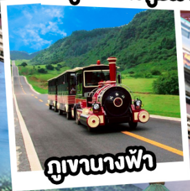
ภูเขาฉางฟ้า