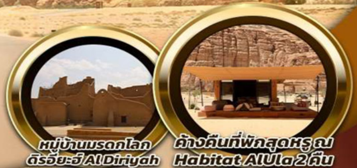
หมู่บ้านมรดกโลก ดิริยาฮ์ AlDiriyah