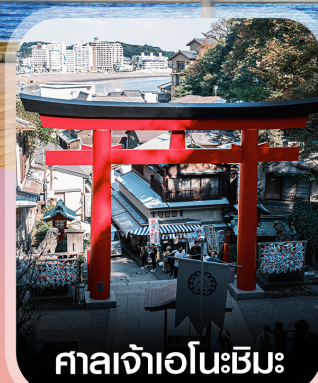
ศาลเจ้าเอโนะชิมะ