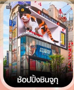
ซ้อปิ้งชินจูกุ

✈️ คอนเฟิร์ม ออกเดินทาง ทุกพีเรียด 2 ท่านขึ้นไป