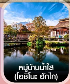
หมู่บ้านน้ำใส (โอชิโนะ ฮักไก)