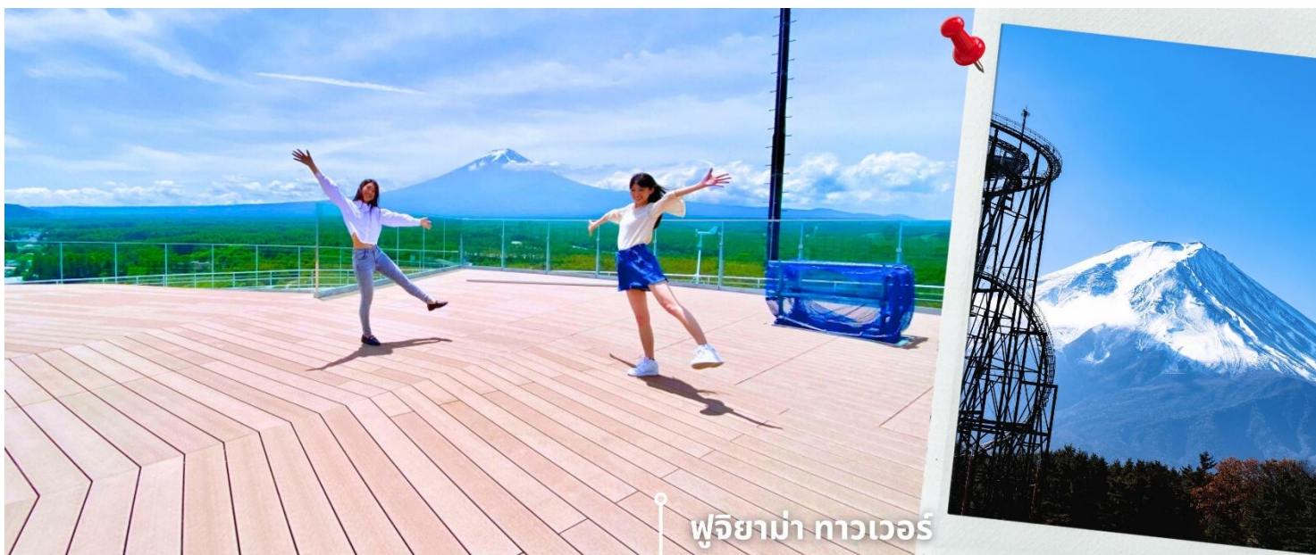
ฟูจิยาม่า ทาวเวอร์

หลังรับประทานอาหารเที่ยง นำท่านเดินทางสู่ หอคอยชมวิวฟูจิยาม่า ทาวเวอร์ จังหวัดยามานาชิ เป็นหอคอยที่สร้างอยู่ภายในรถไฟเหาะ มีความสูงถึง 55 เมตร จึงทำให้เป็นจุดชมวิวที่ให้ท่านได้สัมผัสธรรมชาติและภูเขาไฟฟูจิได้อย่างใกล้ชิดในมุมมองที่แปลกใหม่ ภายในทาวเวอร์มีจุดชมวิวแบบพาโนรามา สามารถมองเห็นภูเขาไฟฟูจิและทิวทัศน์โดยรอบได้อย่างชัดเจน ทั้งยังมีโซนกิจกรรมและมุมถ่ายภาพที่ออกแบบให้ใกล้ชิดกับธรรมชาติ สร้างประสบการณ์ที่ทั้งตื่นเต้นและน่าประทับใจ ให้ท่านอิสระถ่ายภาพตามอัธยาศัย