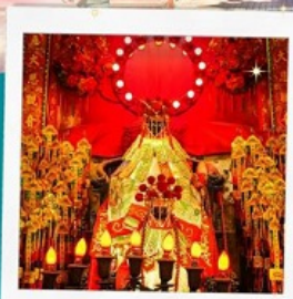
เจ้าแม่กวนอิมฮ่องฮ่า