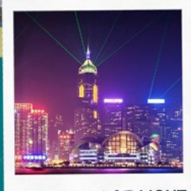
SYMPHONY OF LIGHT