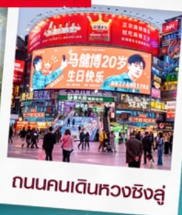
ถนนคนเดินหวงซิงสู๋