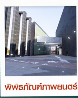
พีฟุรกกันท์กาพยนตร์