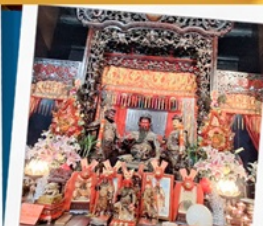
เทพเจ้ากวนอู วัดกวนไท่