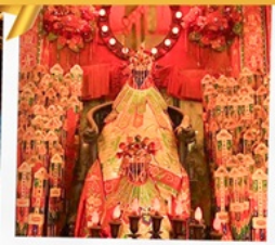
เจ้าแม่กวนอิมฮ่องกง

โรงแรม Eaton Hotel และ iclub Mong Kok Hotel