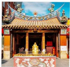
วัดเสียให้เจิ้งหวง

ขอคนรัก วัดเสียให้เจิ้งหวง พักย่านช้อปปิ้งซีเหมินติง ชมทะเลสาบสุริยันจันทรา เมืองโบราณจิวเฟิ่น 4วัน 3คืน