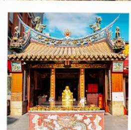
วัดเสี่ยวไท่เจิงหวง