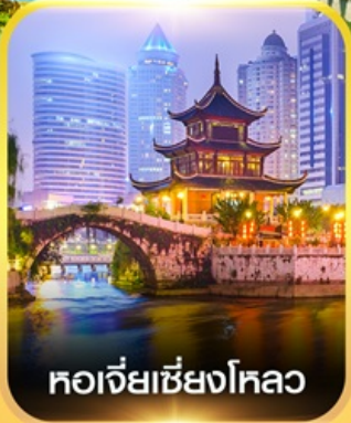
หอเจียเซียงโหลว