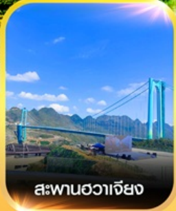
สะพานฮวาเจียง