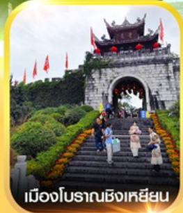
เมืองโบราณชิงเหยียน

✈️ คอนเฟิร์มออกเดินทาง ✈️ ทุกพีเรียด 2 ท่านขึ้นไป