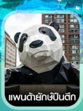
แพนด้ายักษ์ป็นตีก