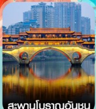
สะพานโบราณอันฮุน