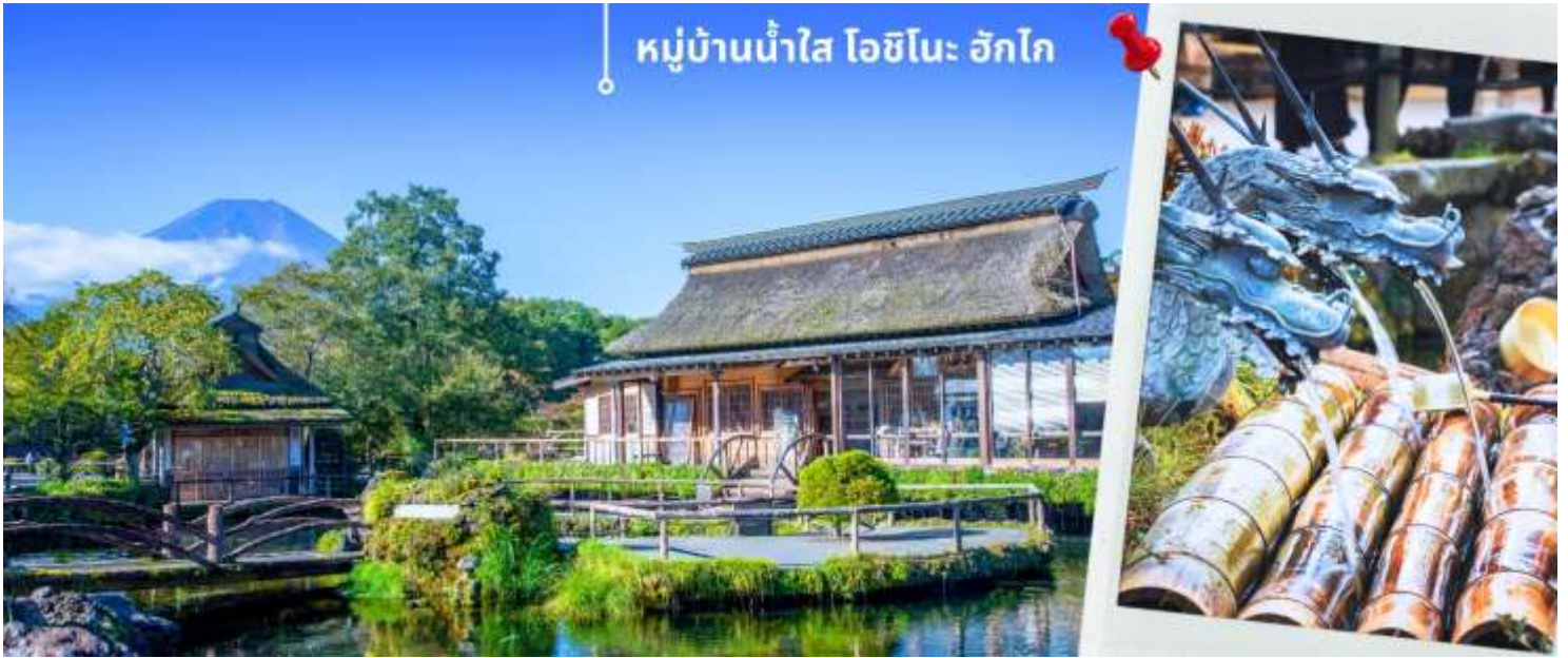
หมู่บ้านน้ำใส โอชิโนะ ะฮักโกะ

จากนั้นท่านเดินทางสู่ จังหวัดชิซุโอกะ Shizuoka เป็นจังหวัดในประเทศญี่ปุ่น ตั้งอยู่ในภูมิภาคชูบุ บนเกาะฮอน มีพื้นที่ยาวตามแนวชายฝั่งมหาสมุทรแปซิฟิก จังหวัดนี้เป็นที่ตั้งของภูเขาฟูจิและมีชื่อเสียงของการปลูกชาเขียวที่ดีที่สุดญี่ปุ่น นำท่านเดินทางช้อปปิ้งที่ โกเทมบะ พรีเมียม เอ้าท์เล็ต Gotemba premium outlet อยู่ที่ฮาโกเน่ (Hakone) ได้ชื่อว่าเป็น Outlet ที่ใหญ่ที่สุดในญี่ปุ่น มีทั้งสินค้าแบรนด์ในประเทศและแบรนด์ต่างประเทศ มีร้านค้ากว่า 200 ร้าน และศูนย์อาหาร ภายในมีร้านค้าต่างๆหลากหลายแบรนด์ ไม่ว่าจะเป็นเสื้อผ้าแฟชั่น อุปกรณ์กีฬา เครื่องใช้ในครัวเรือน และสินค้าอิเล็กทรอนิกส์ แบรนด์ก็จะมีทั้ง Adidas, Alexander McQueen, Alexander Wang, Balenciaga, Birkenstock, Burberry, Bvlgari, Cath Kidston, Celine, G-Shock, Gucci, Issey Miyake, Kate Spade New York, Nike, Ralph Lauren, Ray-Ban, Saint Laurent และแบรนด์อื่นๆอีกมากให้ท่านได้ อิสระช้อปปิ้งตามอัธยาศัย