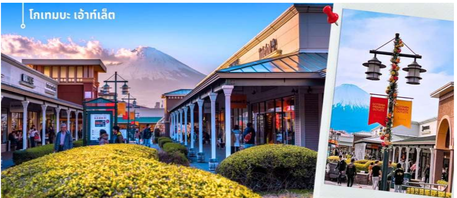
โกเทมบะ เอ้าท์เล็ต

จากนั้นท่านเดินทางสู่ จังหวัดชิซุโอกะ Shizuoka เป็นจังหวัดในประเทศญี่ปุ่น ตั้งอยู่ในภูมิภาคชูบุ บนเกาะฮอน มีพื้นที่ยาวตามแนวชายฝั่งมหาสมุทรแปซิฟิก จังหวัดนี้เป็นที่ตั้งของภูเขาฟูจิและมีชื่อเสียงของการปลูกชาเขียวที่ดีที่สุดญี่ปุ่น นำท่านเดินทางช้อปปิ้งที่ โกเทมบะ พรีเมียม เอ้าท์เล็ต Gotemba premium outlet อยู่ที่ฮาโกเน่ (Hakone) ได้ชื่อว่าเป็น Outlet ที่ใหญ่ที่สุดในญี่ปุ่น มีทั้งสินค้าแบรนด์ในประเทศและแบรนด์ต่างประเทศ มีร้านค้ากว่า 200 ร้าน และศูนย์อาหาร ภายในมีร้านค้าต่างๆหลากหลายแบรนด์ ไม่ว่าจะเป็นเสื้อผ้าแฟชั่น อุปกรณ์กีฬา เครื่องใช้ในครัวเรือน และสินค้าอิเล็กทรอนิกส์ แบรนด์ก็จะมีทั้ง Adidas, Alexander McQueen, Alexander Wang, Balenciaga, Birkenstock, Burberry, Bvlgari, Cath Kidston, Celine, G-Shock, Gucci, Issey Miyake, Kate Spade New York, Nike, Ralph Lauren, Ray-Ban, Saint Laurent และแบรนด์อื่นๆอีกมากให้ท่านได้ อิสระช้อปปิ้งตามอัธยาศัย