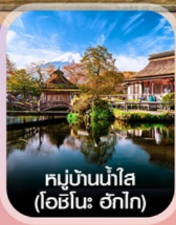
หมู่บ้านน้ำใส (โอชิโนะ วัตโก)