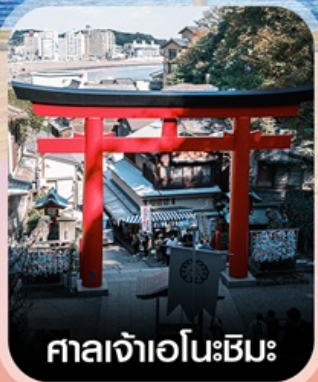
ศาลเจ้าเอโนะชิมะ