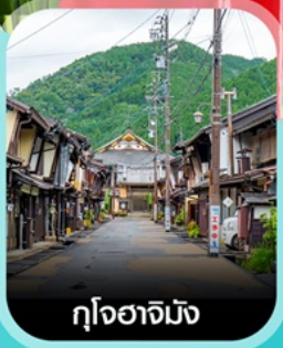
กูโจฮาจิมาจิ