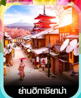
ย่านอิคาชิยาม่า