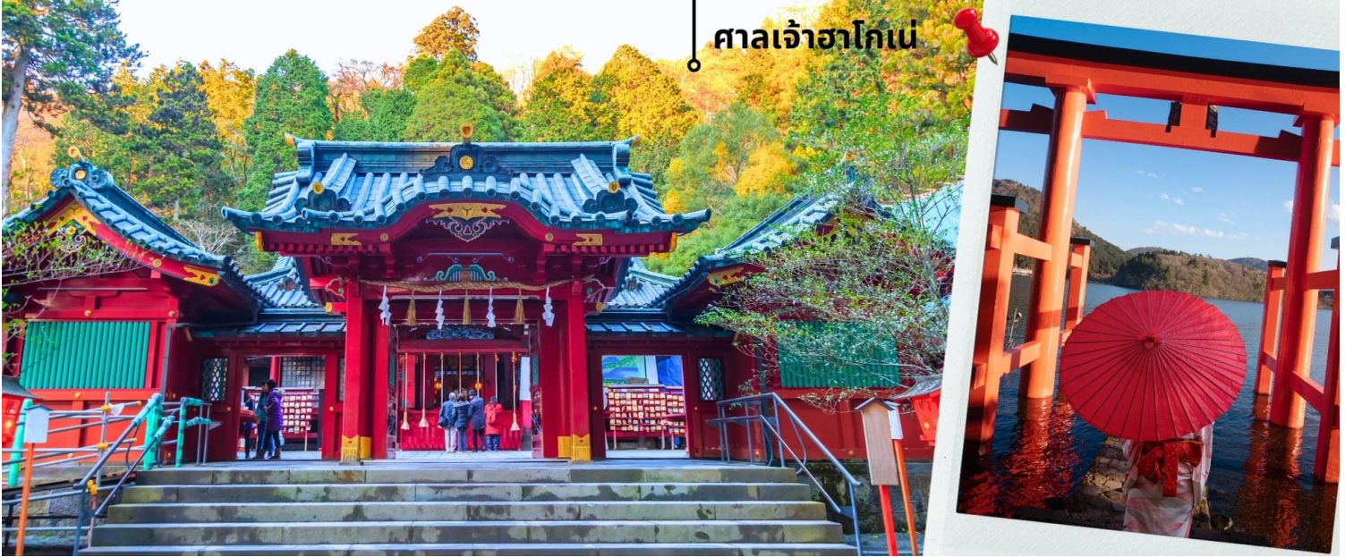
ศาลเจ้าฮาโกเน่

เพื่อเดินทางไหว้ขอพรกันต่อที่ ศาลเจ้าฮาโกเน่ Hakone Shrine ก่อตั้งขึ้นในปี ค.ศ. 757 ในรัชสมัยของจักรพรรดิ โคโช เป็นหนึ่งในศาลเจ้าที่ในอดีตเหล่าขุนพลแะเวียนมาที่นี่เพื่อมาสวดภาวนา เนื่องจากมีความเชื่อว่าศาลเจ้าแห่งนี้จะ นำโชคมาสู่ในเรื่องของการต่อสู้ ทำให้ศาลเจ้าแห่งนี้มีชื่อเสียงโด่งดังไปทั่วประเทศ และยังได้รับการขึ้นทะเบียนในปี ค.ศ. 1875 ให้เป็นศาลเจ้าลำดับที่ 3 ในบรรดาศาลเจ้าแห่งชาติของญี่ปุ่น ปัจจุบันนี้ผู้คนนิยมมาสักการะขอพรในเรื่องของการ เดินทางให้แคล้วคลาด รวมไปถึง