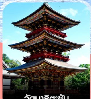
วัดนารินเซ็น