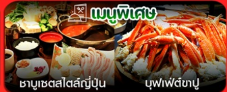
ชาบูเซตสไตล์ญี่ปุ่น