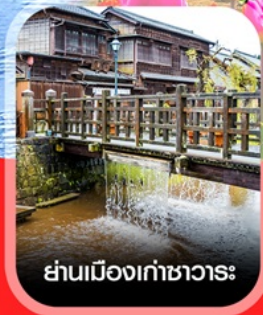
ย่านเมืองเก่าซาวาระ

✈️ คอนเฟิร์มออกเดินทาง ทุกพีเรียด 2 ท่านขึ้นไป