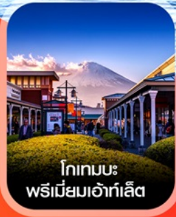
โกเทมบะ พรีเมียมเอ้าท์เล็ต