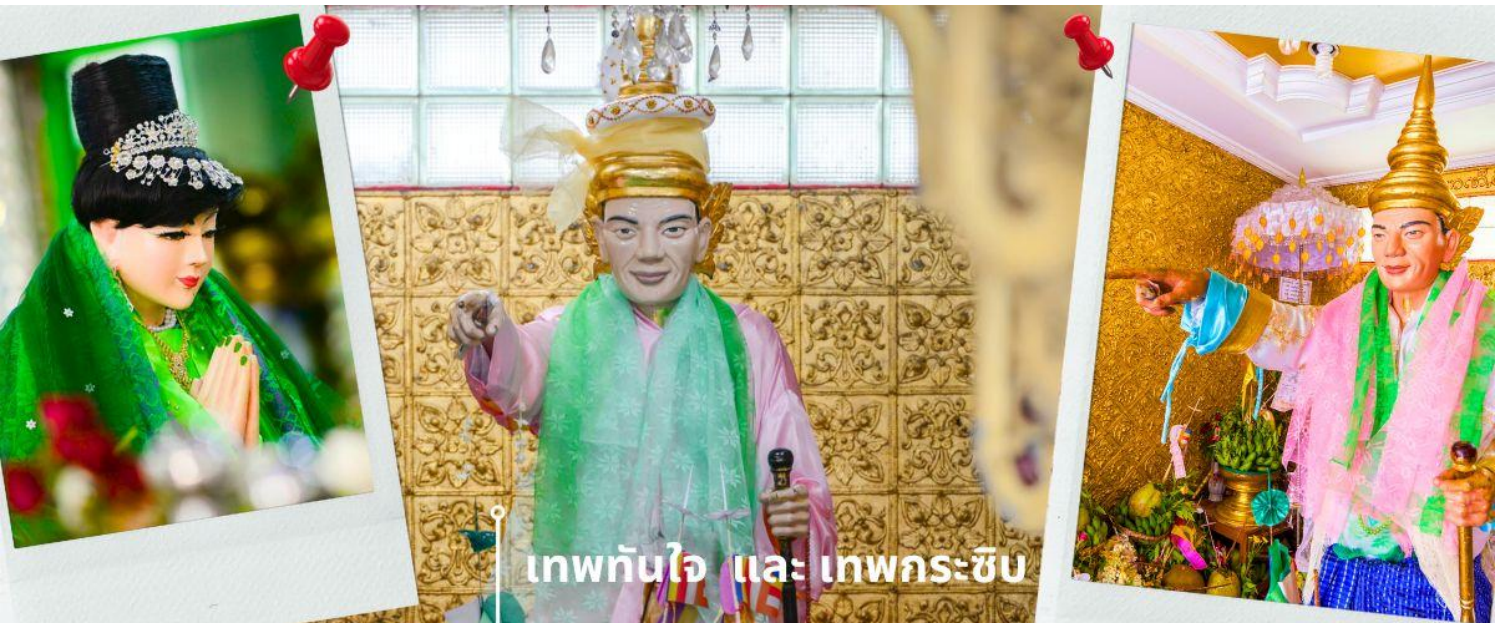
เทพทันใจ และ เทพกระซิบ

เช้า รับประทานอาหารเช้า ที่ โรงแรม (3) เจดีย์โบตาทาว (Botahtaung Pagoda) หมายถึง ทหาร 1,000 นาย เมื่อในอดีตพระเจ้าโองะลาปะกษัตริย์มอญ ได้ให้ทหาร 1,000 นาย ตั้งแถวถวายความเคารพพระเกศาธาตุ บรรจุไว้ 1 เส้น ในเจดีย์นี้ ที่อันเชิญมาจากอินเดีย ไฮไลท์ที่สำคัญที่นักท่องเที่ยวนิยมมาสถานที่แห่งนี้คือ การมาสักการะบูชา เทพทันใจ หรือ นัตโบโบยี และยังมี เทพกระซิบ ภายในเจดีย์เป็นที่เก็บผอบหินทรงสลับพบสมบัติล้ำค่าหลายชนิดเช่น อัญมณี, เครื่องประดับ, เพชรพลอย, จารึกดินเผา, และพระพุทธรูปทองคำ, เงิน, ทองเหลือง, หิน พระพุทธรูปจำนวนทั้งหมดภายในและภายนอกผอบราวกว่า 700 องค์ จารึกดินเผาบางส่วนเป็นเรื่องราวของคำสอนและเรื่องราวทางพุทธศาสนาของนัตโบโบยี หรือ คนไทยรู้จักกันในชื่อว่า เทพทันใจ เป็นคำเรียกเทพเจ้านัต ที่เป็นเทพารักษ์ประจำวัดหรือพระเจดีย์ในศาสนาพุทธแบบพม่า โดยทั่วไปนิยมสร้างรูปเคารพโบโบยี เป็นรูปเคารพชายสูงวัยขนาดเท่าบุคคล สวมเครื่องประดับศิระ บางครั้งถือไม้เท้าเพื่อย้ำถึงความอาวุโส เทพทันใจแห่งนี้ เป็นสถานที่ที่คนไทยให้ความนับถือเป็นอย่างมาก เชื่อกันว่าการได้มาขอพรกับ นัตโบโบยี จะสัมฤทธิ์ผลทุกประการ จนเป็นที่กล่าวถึงและเล่าขานสืบกันมาช้านาน โดยใกล้กันยังมี เทพกระซิบ ซึ่งมีนามว่า “อะมาดอว์เม็ยะ” ตามตำนานกล่าวว่า นางเป็นธิดาของพญานาค ที่เกิดศรัทธาในพุทธศาสนาอย่างแรงกล้า รักษาศีล ไม่ยอมกินเนื้อสัตว์จนเมื่อสิ้นชีวิตไปกลายเป็นนัต