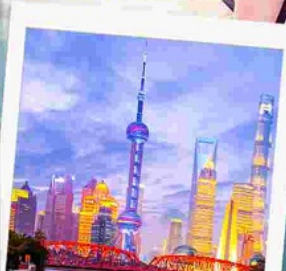
ทาดว่ายทาน