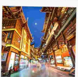
ตลาดเดินหัวงเมี่ยว