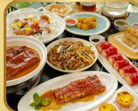
อาหารระดับ มิชลิน