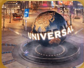
เที่ยวสวนสนุก