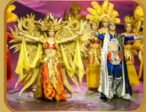
ชมสุดยอดโชว์ตระการตา