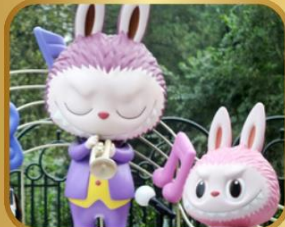
เที่ยวสวนสนุก