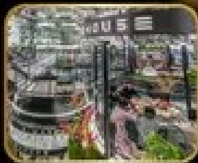
ภัตตาคาร ดินแดน WAREHOUSE NO.3